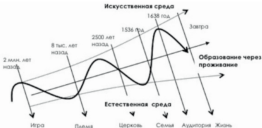
Рисунок 3. Диалектика развития парадигм образования

Так объективный ход развития образования привел к ситуации, в которой оно находится теперь, ища новые формы своего продуктивного существования (Рис. 3).