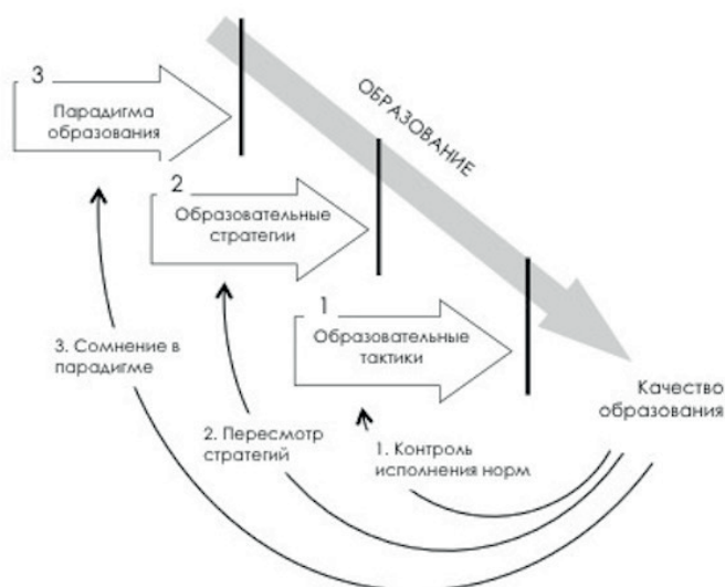
Рисунок 2. Модель трех кругов рефлексии образовательной деятельности

«Механика» понижения качества и результативности образовательной деятельности принуждает к запуску трех «кругов ее рефлексии» (Рис. 2).